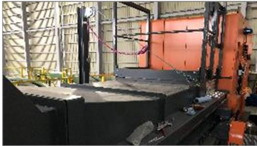
センサー式選別機